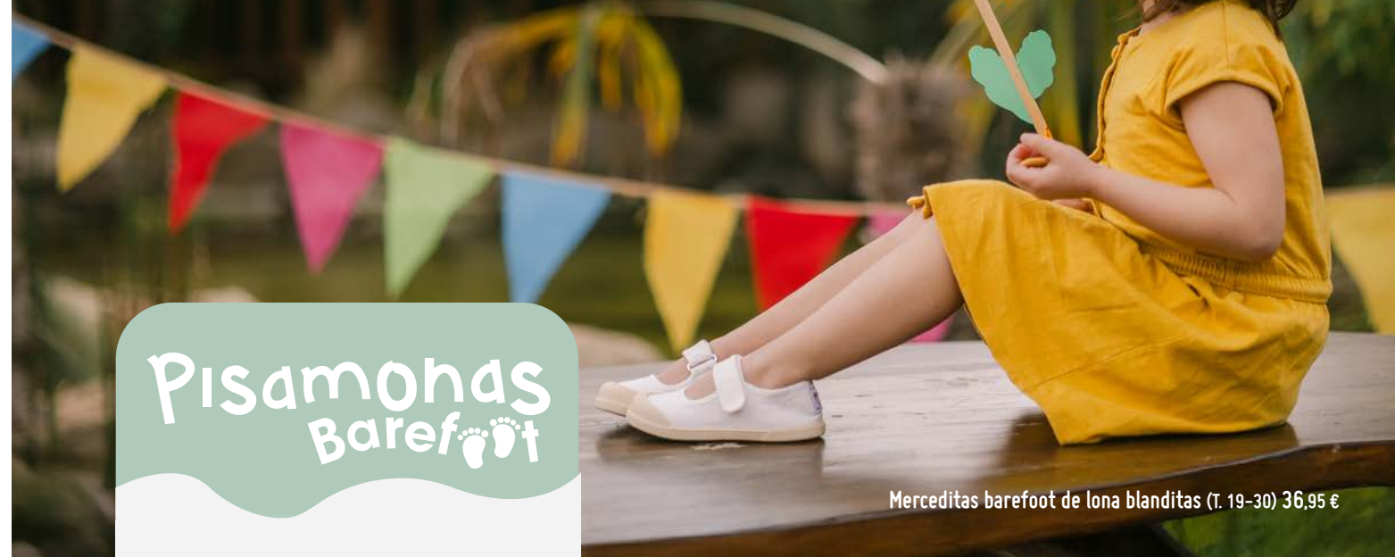
Merceditas barefoot de lona blanditas (T. 19-30) 36,95 €