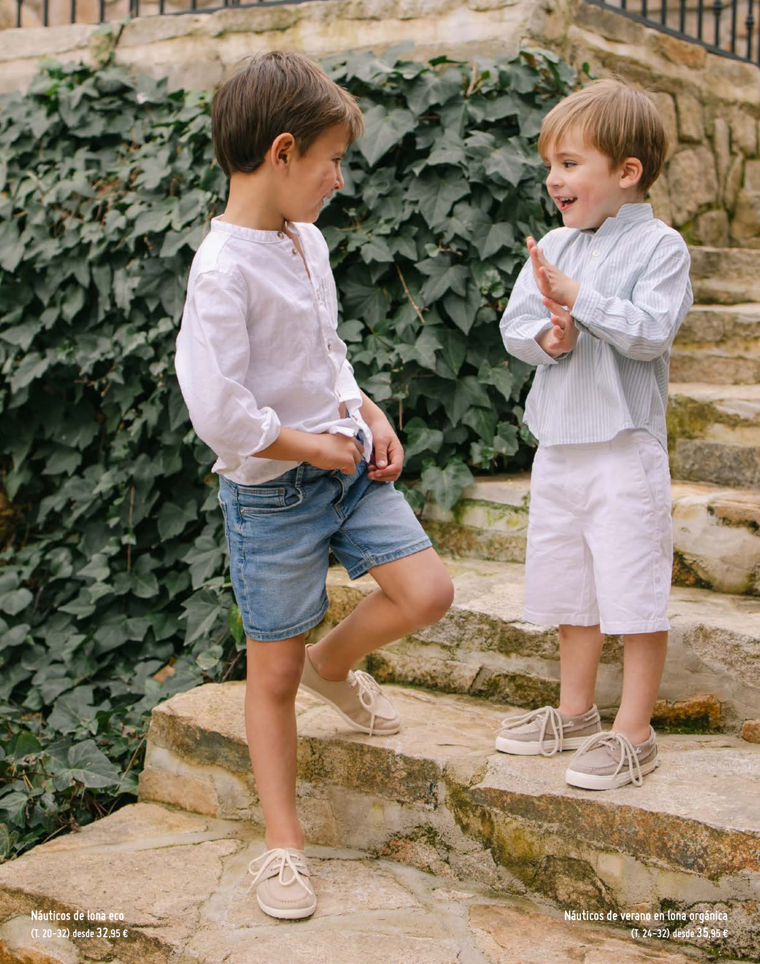
Náuticos de lona eco (T. 20-32) desde 32,95 €