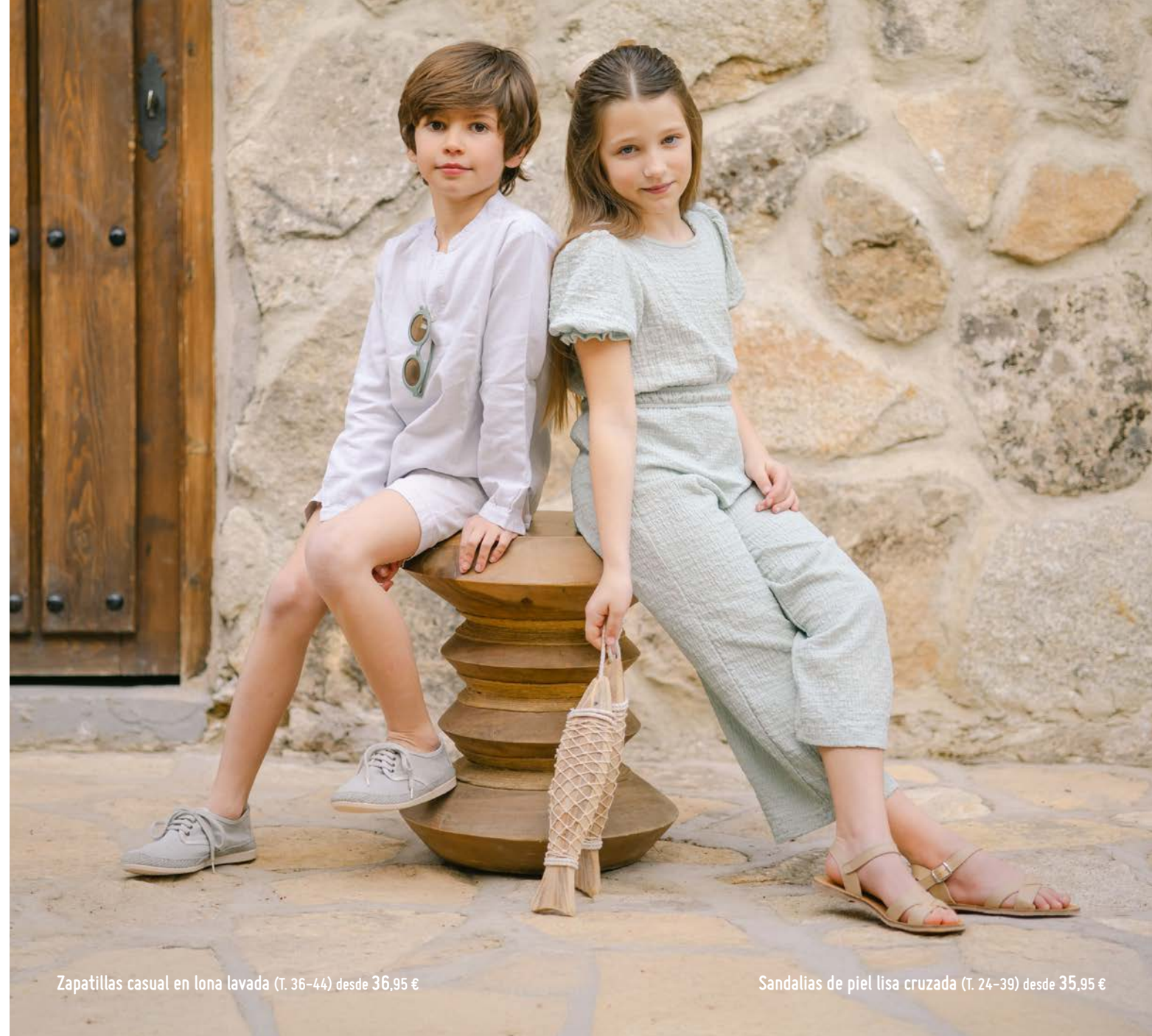
Zapatillas casual en lona lavada (T. 36-44) desde 36,95 €