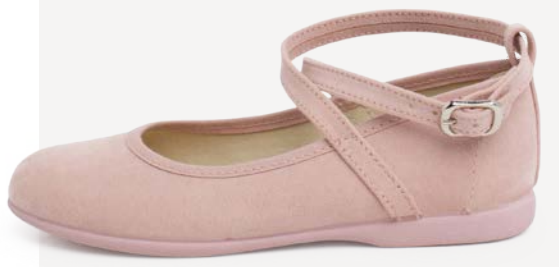
Merceditas tipo ante con tira cruzada y hebilla (T. 28-38) desde 34,95 €