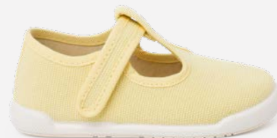
Pepitos barefoot de lona canvas y tira adherente (T. 20-26) 36,95 €