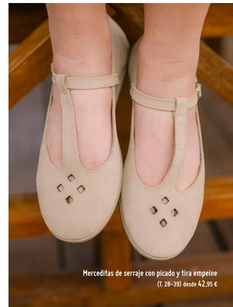
Merceditas de serraje con picado y tira empeine (T. 28-39) desde 42,95 €