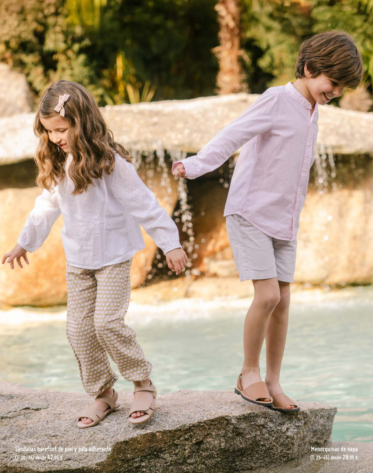
Sandalias barefoot de piel y pala adherente (T. 20-34) desde 42,95 €