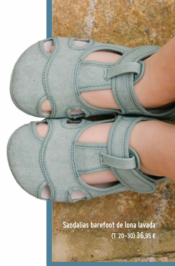
Sandalias barefoot de lona lavada (T. 20-30) 36,95 €