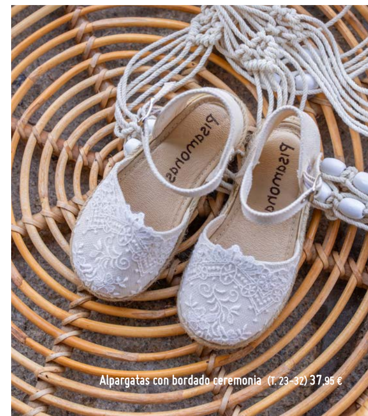
Alpargatas con bordado ceremonia (T. 23-32) 37,95 €