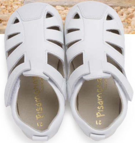
Sandalias blanditas de napa con suela fina (T. 19-26) 50,95 €