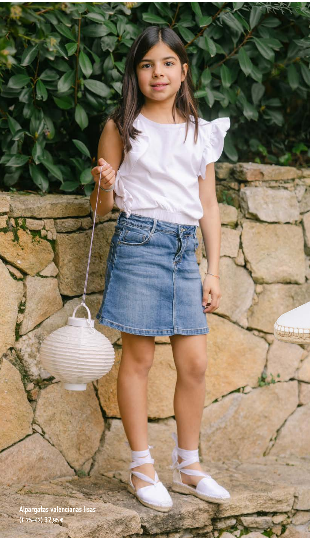
Alpargatas valencianas lisas (T. 25-42) 32,95 €