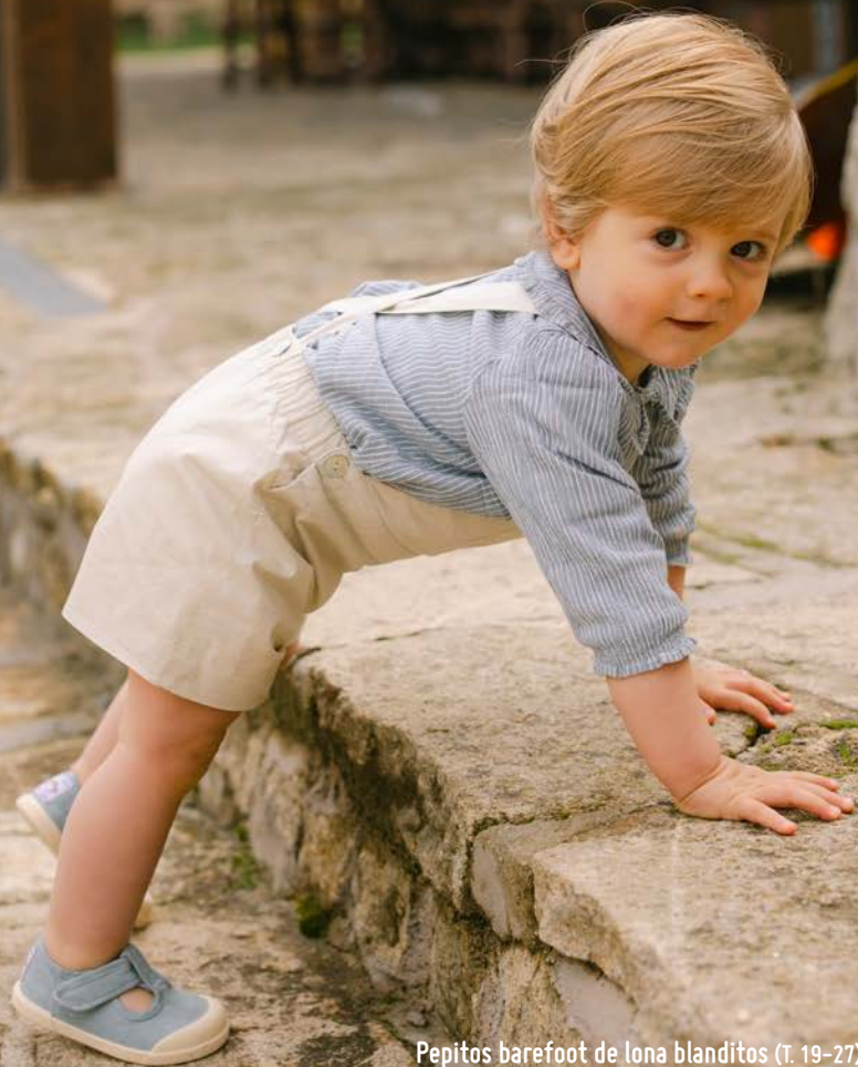
Pepitos barefoot de lona blanditos (T. 19-27) 36,95 €