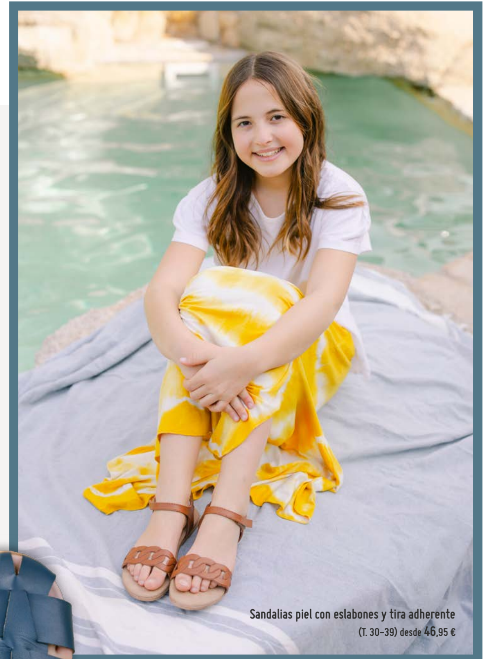
Sandalias piel con eslabones y tira adherente (T. 30-39) desde 46,95 €