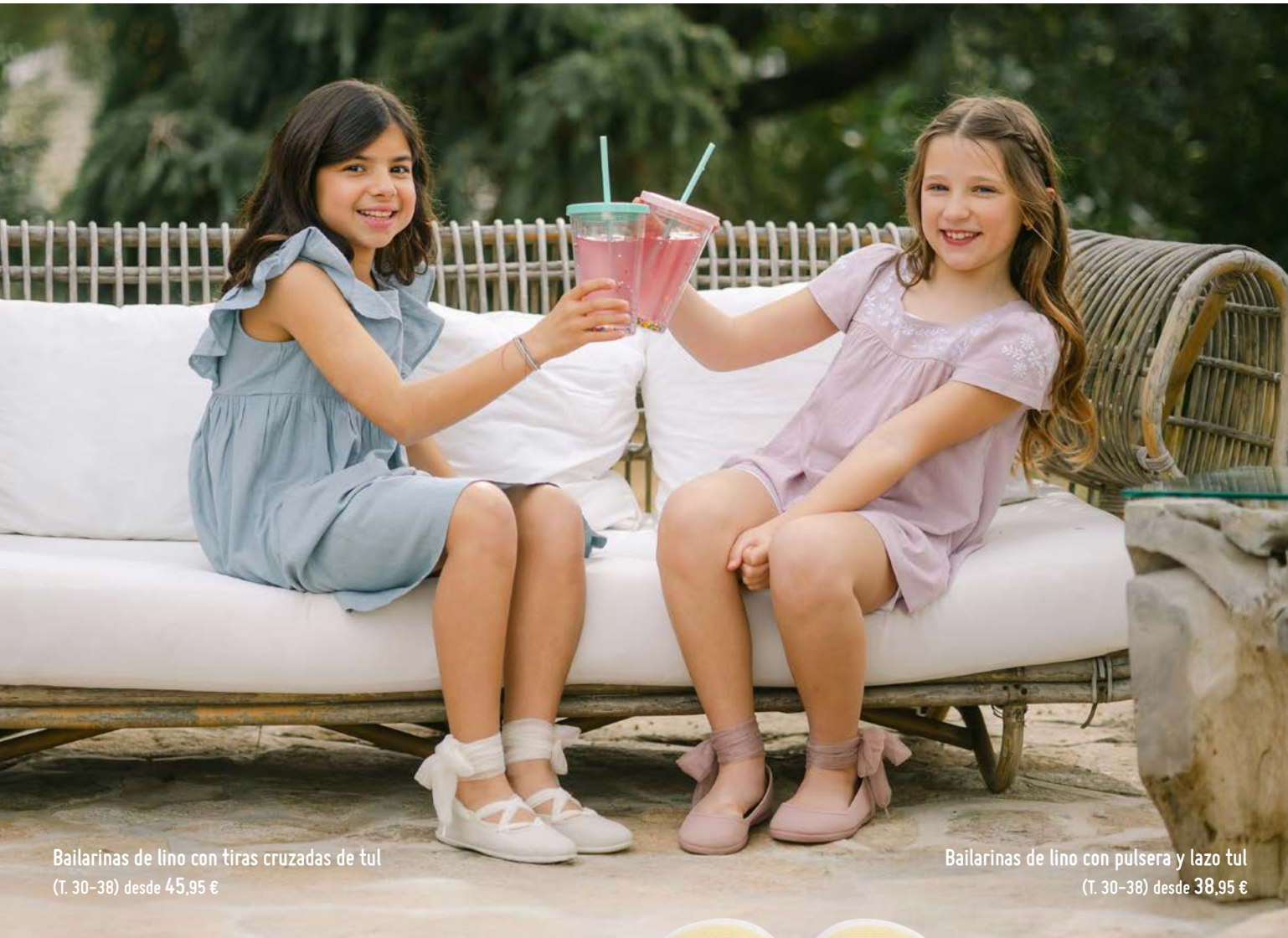
Bailarinas de lino con tiras cruzadas de tul (T. 30-38) desde 45,95 €