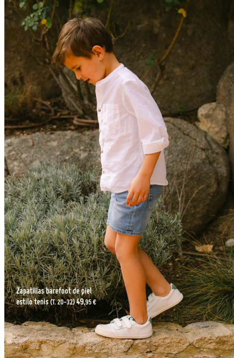
Zapatillas barefoot de piel estilo tenis (T. 20-32) 49,95 €