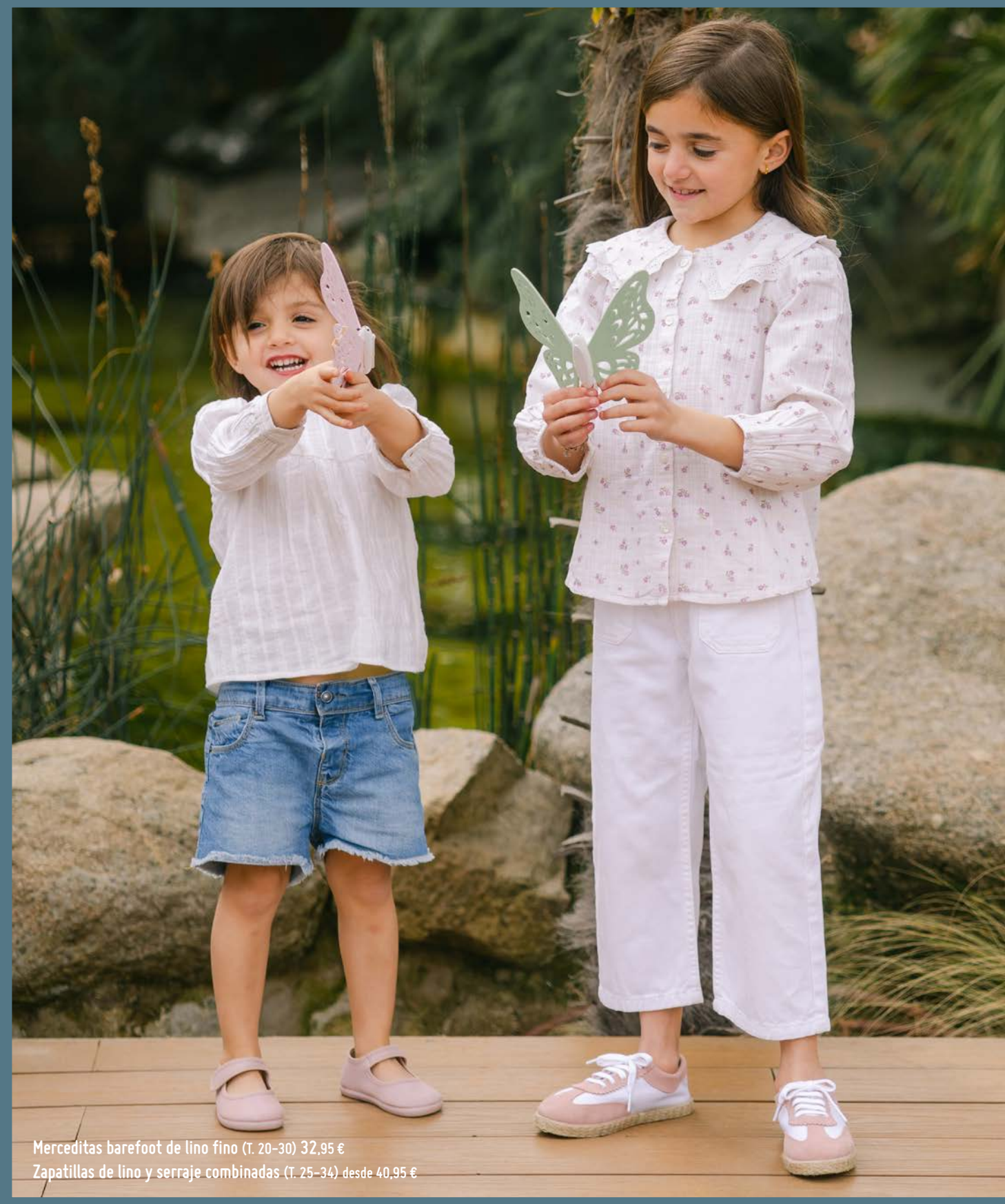
Merceditas barefoot de lino fino (T. 20-30) 32,95 € Zapatillas de lino y serraje combinadas (T. 25-34) desde 40,95 €