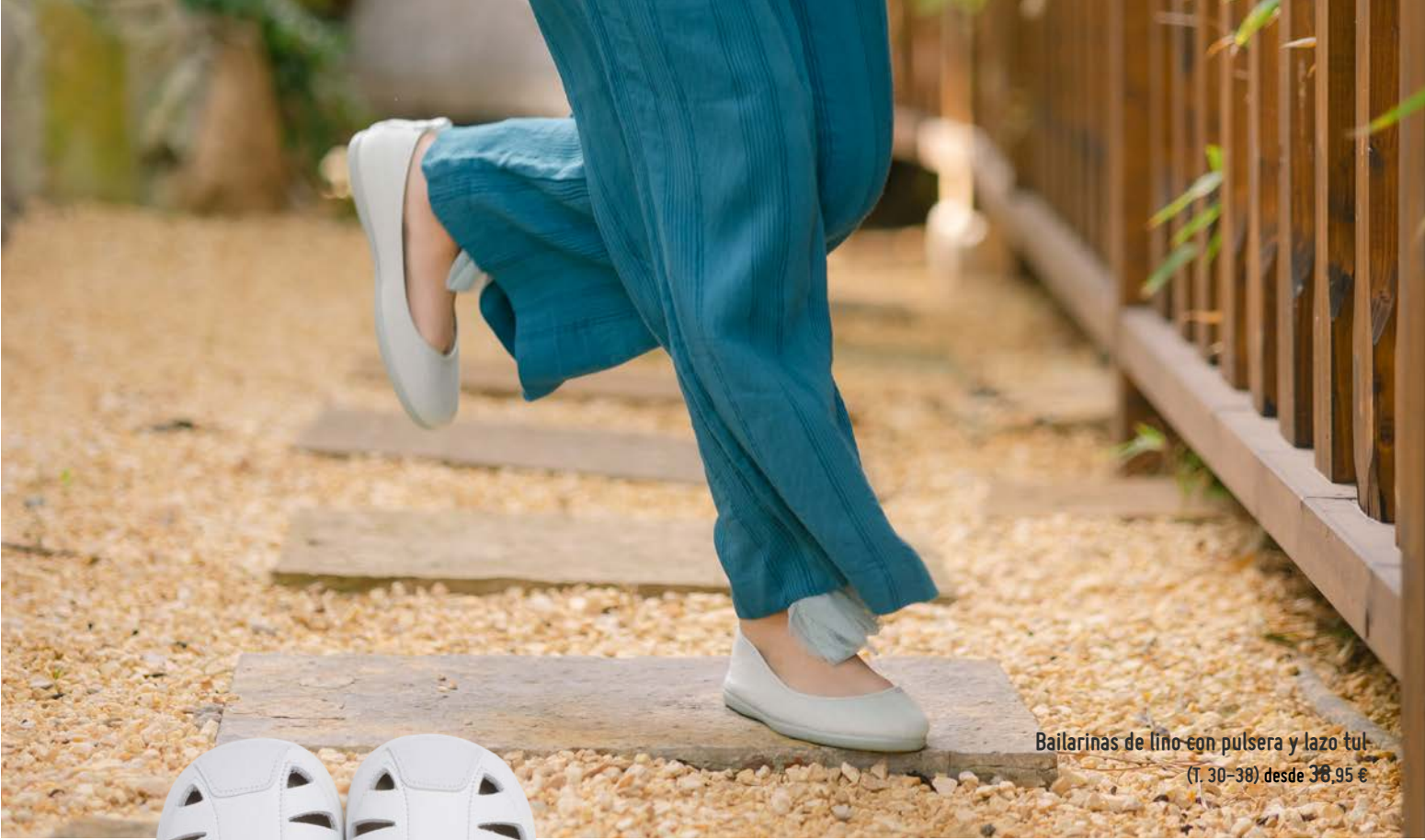
Bailarinas de lino con pulsera y lazo tul (T. 30-38) desde 36,95 €