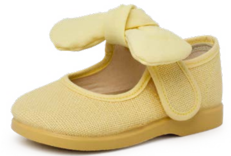
Merceditas de lino con lazo y cierre adherente (T. 18-26) 26,95 €

En las siguientes páginas encontrarás artesanía, mucho estilo y últimas tendencias. Tonos metalizados, colores empolvados y materiales ligeros y transpirables. Líneas minimalistas y estilizadas conviven con nuevos modelos barefoot que se adaptan a cada pie con el máximo cuidado en todos los detalles. Alpargatas, sandalias y cangrejeras listas para el sol completan una colección pensada para disfrutar sin límites. ¡Que empiece la temporada más bonita del año!