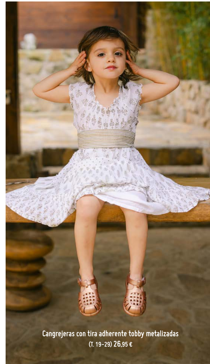
Cangrejas con tira adherente toby metalizadas (T. 19-29) 26,95 €