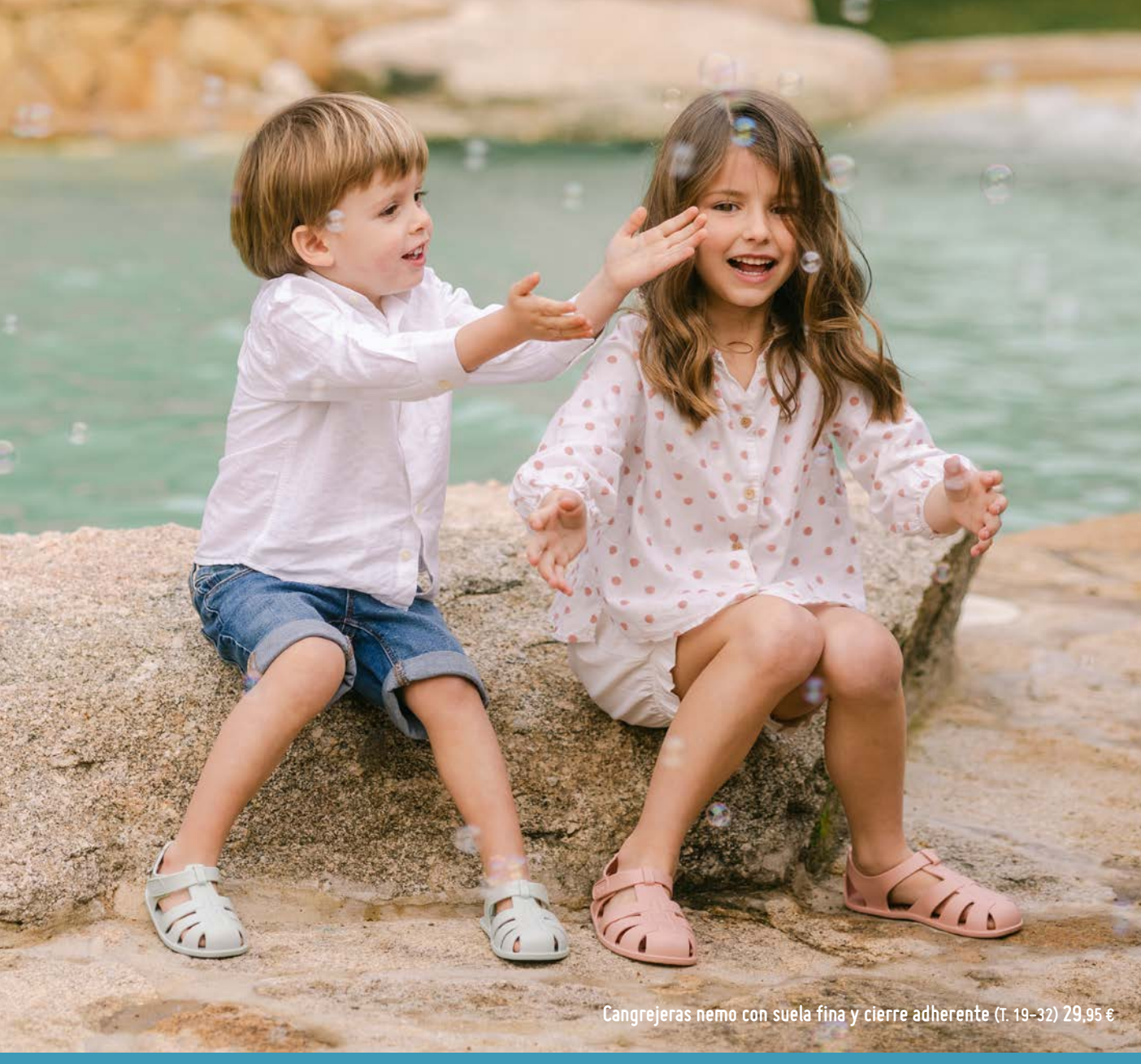
Cangrejas nemo con suela fina y cierre adherente (T. 19-32) 29,95 €