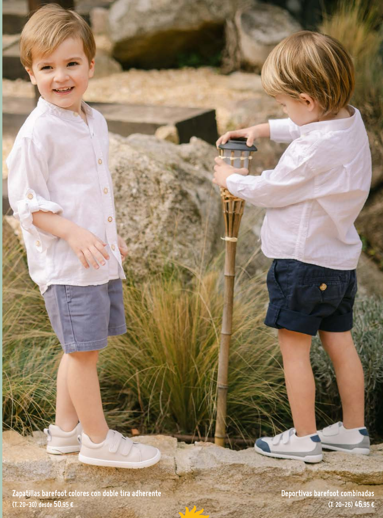
Zapatillas barefoot colores con doble tira adherente (T. 20-30) desde 50,95 €