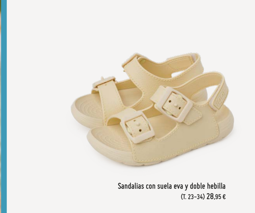
Sandalias con suela eva y doble hebilla (T. 23-34) 28,95 €