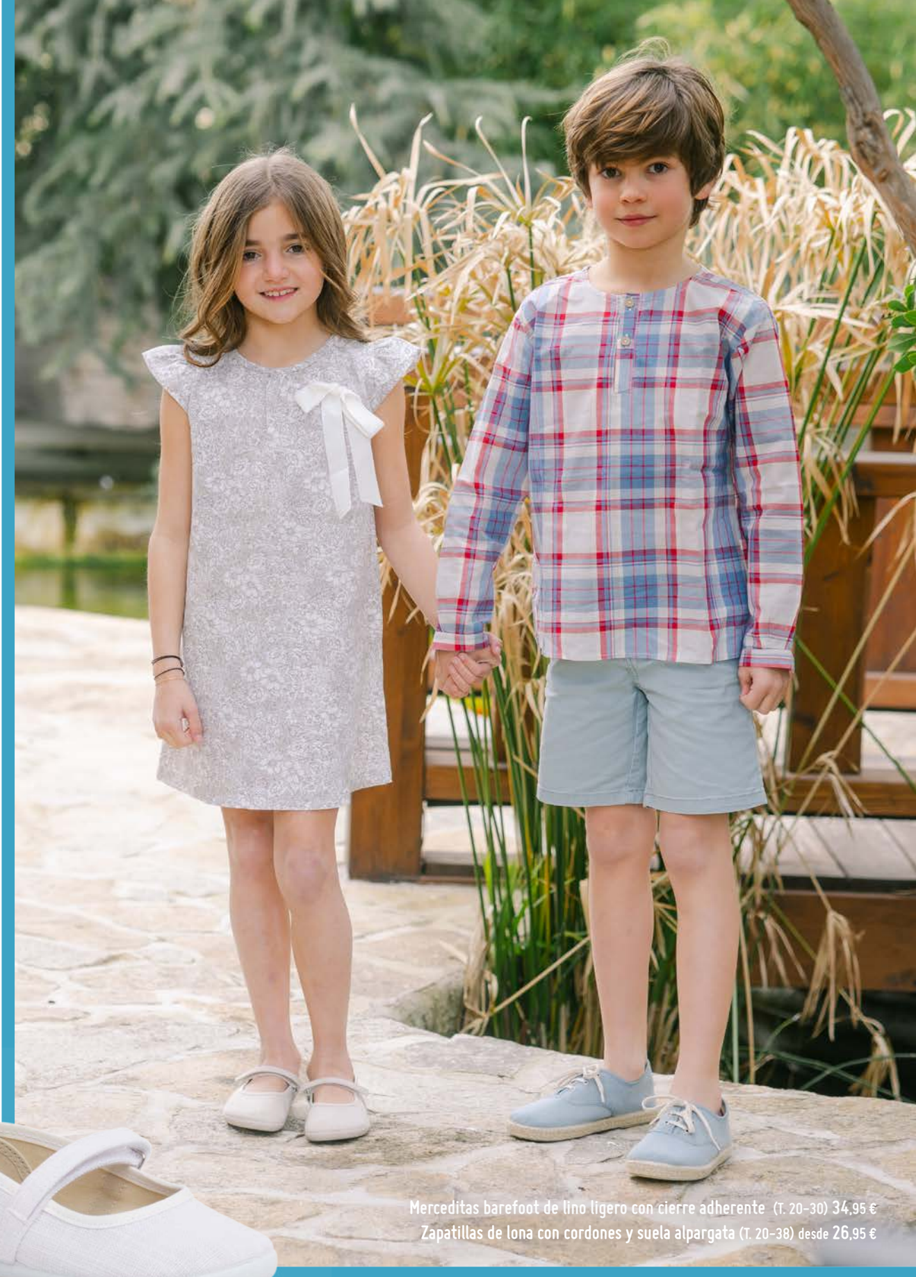
Merceditas barefoot de lino ligero con cierre adherente (T. 20-30) 34,95 € Zapatillas de lona con cordones y suela alpargata (T. 20-38) desde 26,95 €