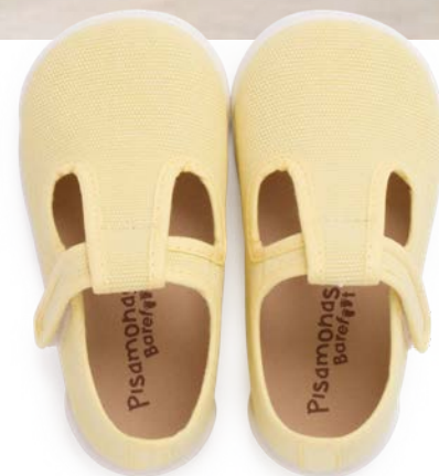
Pepitos barefoot de lona canvas tira adherente (T. 20-26) 36,95 €