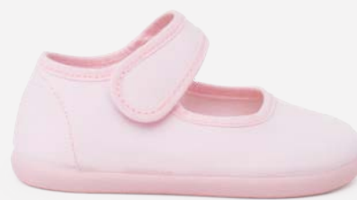
Merceditas barefoot de lona con cierre ancho (T. 20-30) 30,95 €