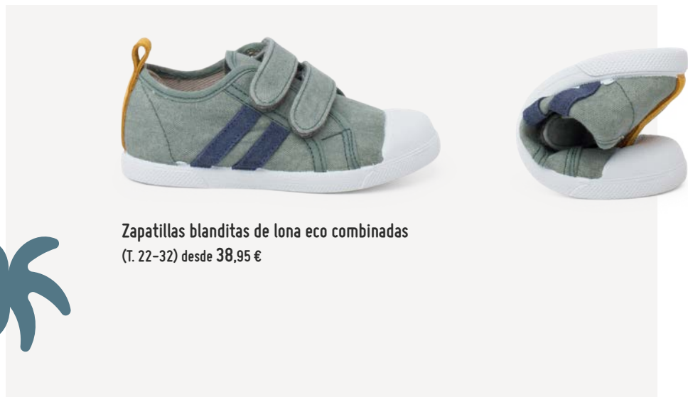
Zapatillas blanditas de lona eco combinadas (T. 22-32) desde 38,95 €