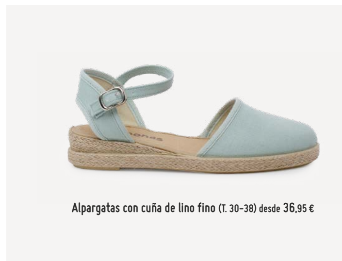
Alpargatas con cuña de lino fino (T. 30-38) desde 36,95 €