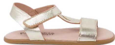
Sandalias barefoot con tiras empeine metalizadas (T. 20-34) desde 44,95 €