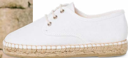
Blucher de lona con base alpargata (T. 24-41) desde 36,95 €