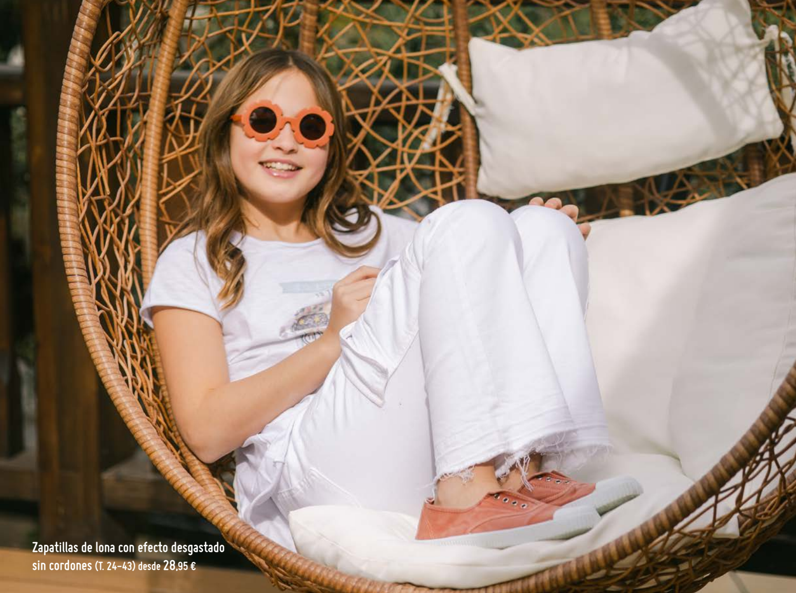
Zapatillas de lona con efecto desgastado sin cordones (T. 24-43) desde 28,95 €