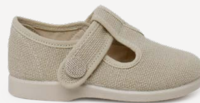
Pepito de lino con cierre adherente botón (T. 19-26) 26,95 €